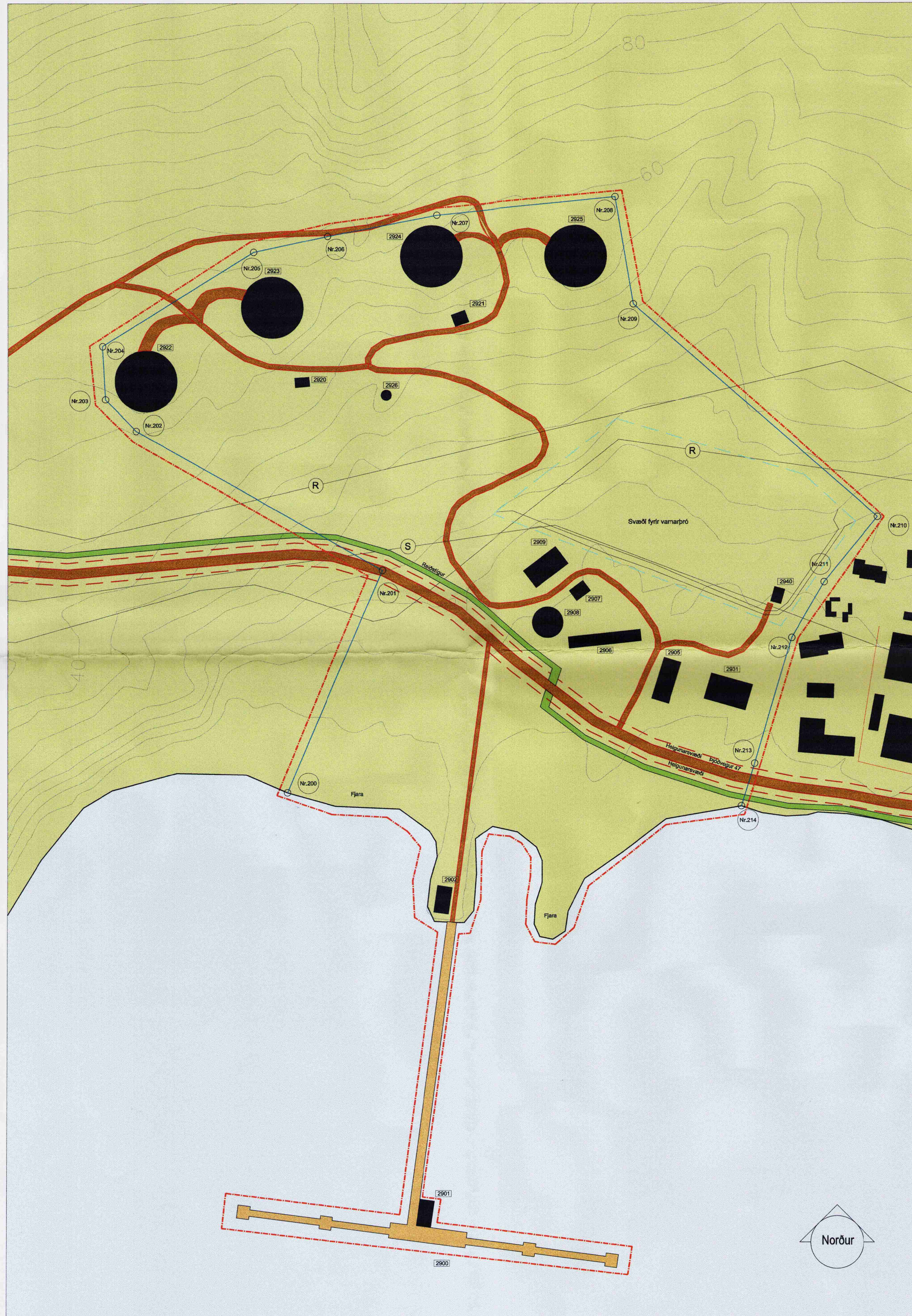
Uppdráttur í mælikvarða 1:2000