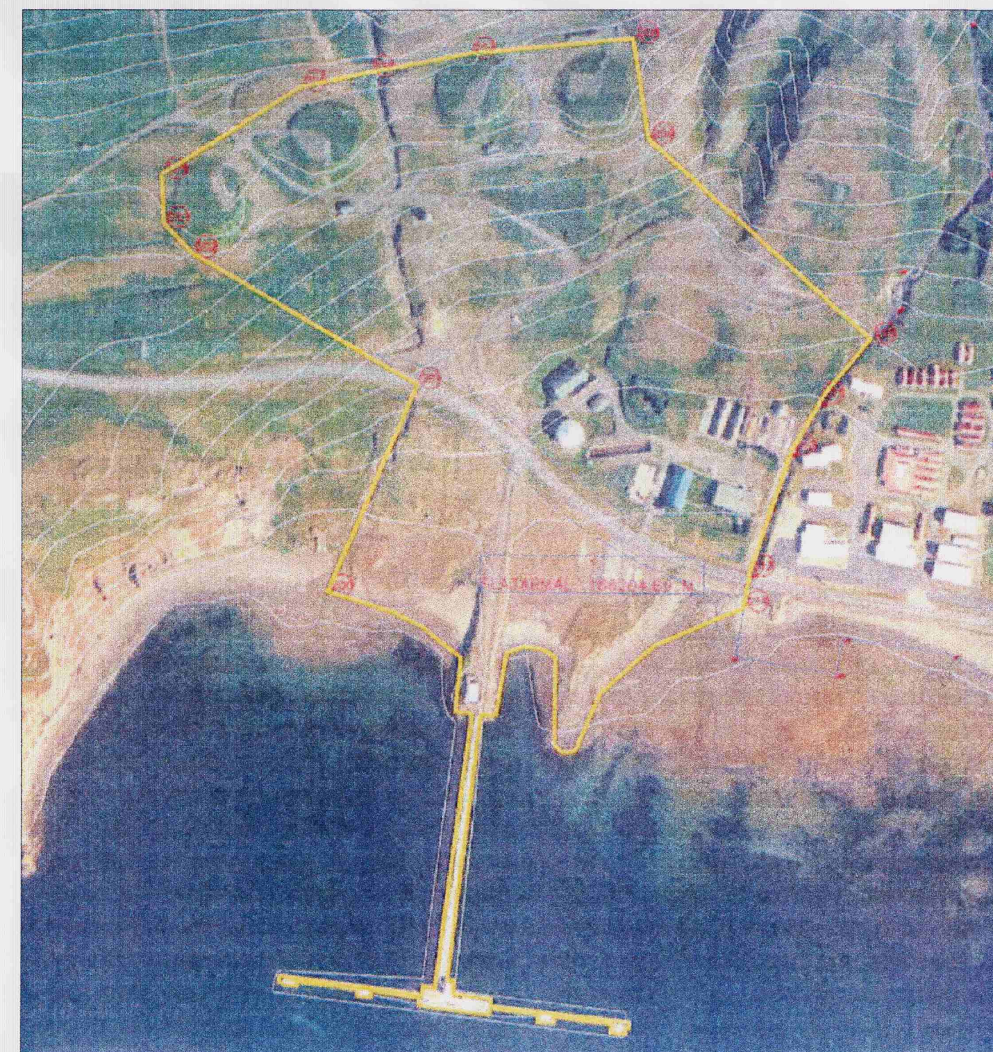
Loftmynd með lóðamörkum

Ný varnarpö verður byggð samkvæmt teikningum verkfræðistofunnar Mannvits og er háð kröfum og samþykki Umhverfisstofnunar.